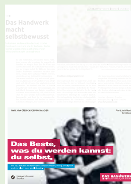
Halbe Seite 233 mm breit x 150 mm hoch 4.462,50 € / 5.250,- €