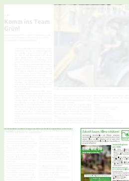
Doppelte Visitenkarte 92 mm breit x 100 mm hoch 1.190,- € / 1.400,- €

Alle genannten Preise verstehen sich netto zzgl. MwSt.; 1. Preis = Ortspreis für Direktkunden / 2. Preis = Grundpreis für Agentur- bzw. überregionale Kunden.