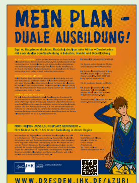
Ganze Seite 233 mm breit x 327 mm hoch 9.728,25 € / 11.445,- €